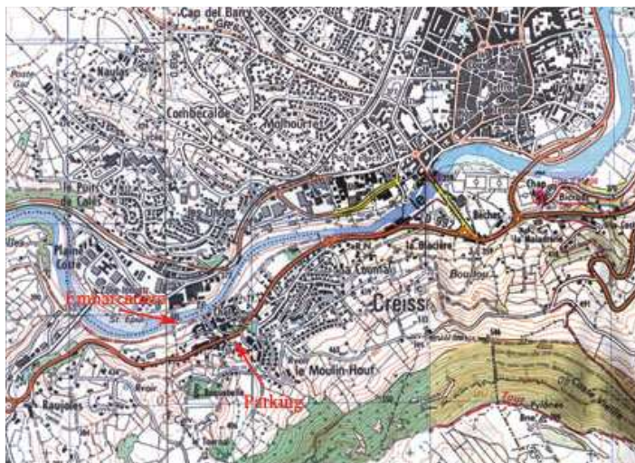
CREISSELS : PARKING G1- matin et G2 apm